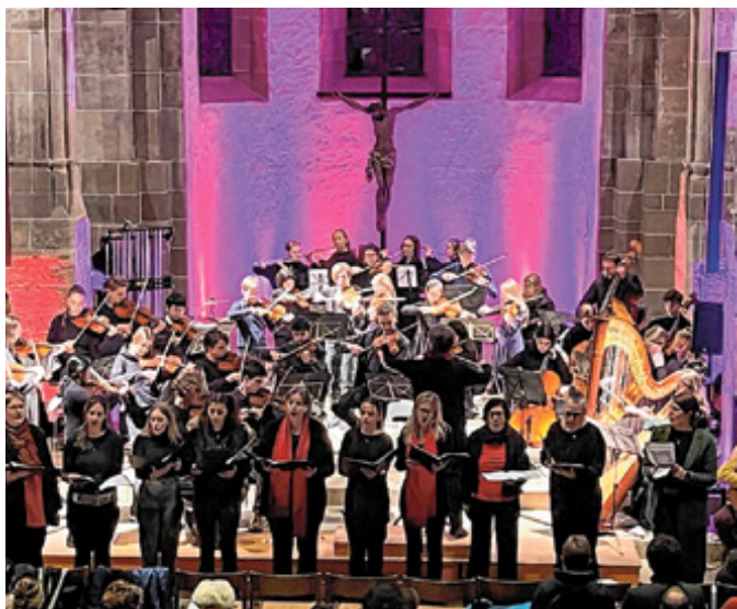
Weihnachtskonzert in der Martinskirche 2023