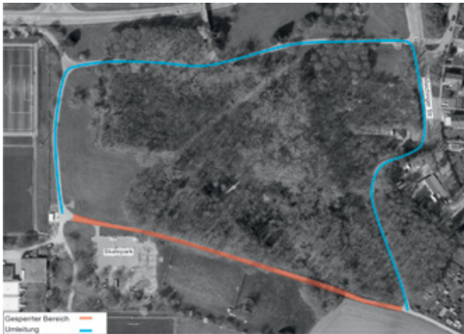
Skizze Umleitung für Fußgänger und Radfahrer